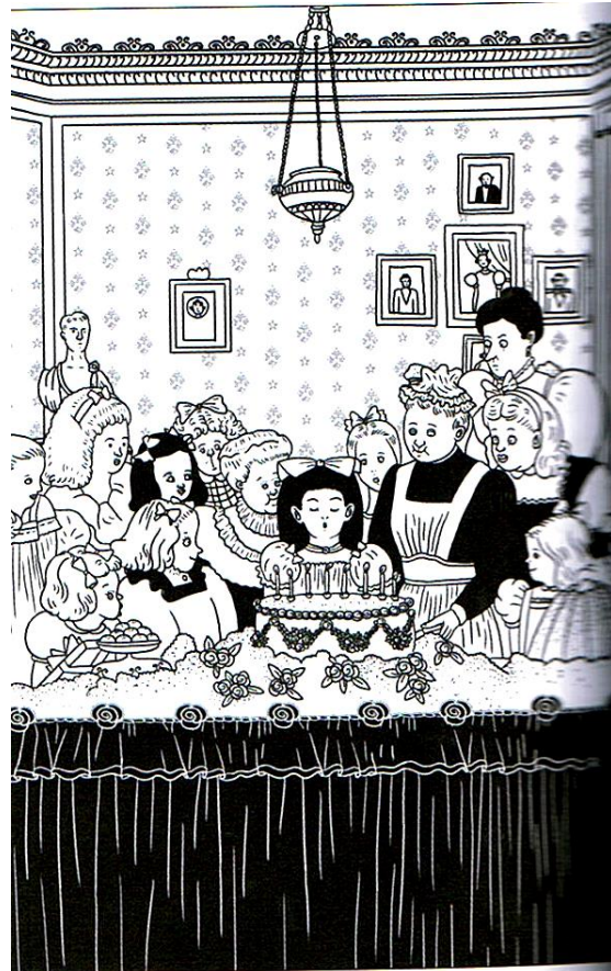
איור מס' 2

יגוהגהגה אל דלת עלית הגג ופתחה אותה. היא חשה רלרה מיטני תנועה יגוהגה