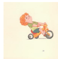
מתוך השיר בן שנתיים דני עמוד 20