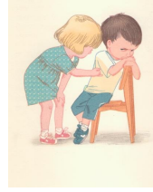
מתוך השיר נתפייסה עמוד 27