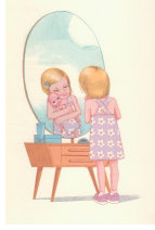
מתוך השיר אלישבע מה נחמדת עמוד 19