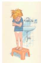
מתוך השיר הסבון בכה מאד עמוד 33