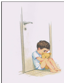
איור ב מתוך לבדי