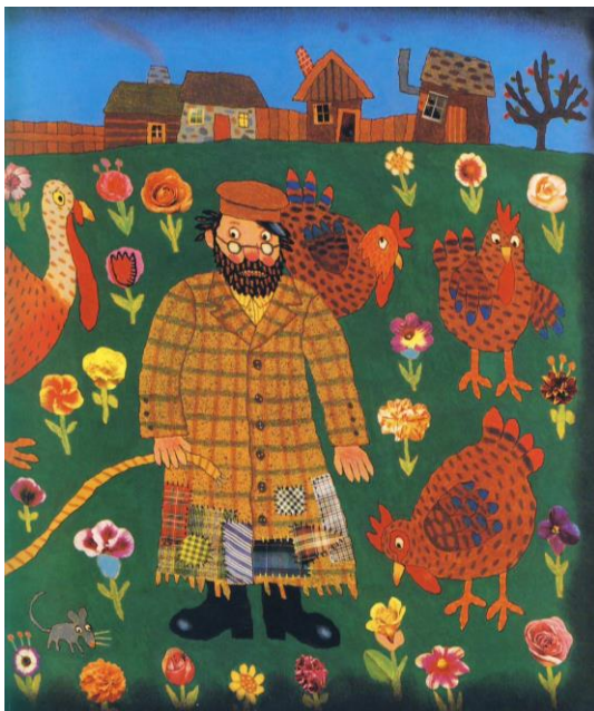
הכפר (איור מס 2)